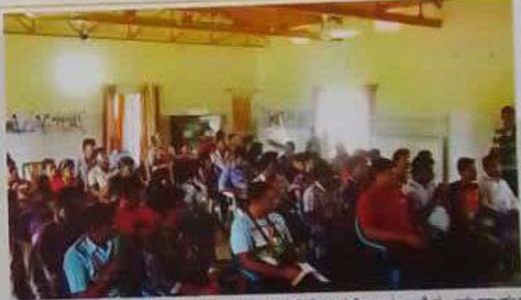
ದಿನಾಂಕ: 23-6-2014 ರಂದು ಶರಣ್ಯ ಆರೈಕೆ ಕೇಂದ್ರಕ್ಕೆ ಆರ್ಯವೈಷ್ಯ ಮಹಾಸಭೆ (ಕೇರಳ, ಮಹಾರಾಷ್ಟ್ರ, ಓಡಿಷ್ಠಾ ಹಾಗೂ ತಮಿಳುನಾಡು) ವಿದ್ಯಾರ್ಥಿಗಳು ಭೇಟಿ ನೀಡಿದರು. ಇವರುಗಳು "ಶರಣ್ಯ"ದ ಬಗ್ಗೆ ಮಾಹಿತಿ ಪಡೆದು ಅಲ್ಲಿನ ಆಯುರ್ವೇದ ಹಾಗೂ ನವಗ್ರಹ ವನದ ವೀಕ್ಷಣೆ ಮಾಡಿದರು. ಅಲ್ಲಿ ನೋಂದಣಿಯಾಗಿದ್ದ ರೋಗಿ ಗಳಿಗೆ ಸಾಂತ್ವನ ನೀಡಿದರು.