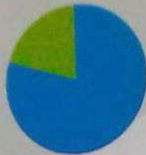
In-Patient admission for the period of June-Aug 2014

ಸಾಂಸ್ಕೃತಿಕ ಹೆಜ್ಜೆ ಹೊಡೆದ ದಿನ, ಅದರ ಪ್ರತಿಭೆ ಉತ್ತರವು ತಪ್ಪಿದ್ದು. ಹೀಗೆ ಎಷ್ಟೋ ಉದಾಹರಣೆಗಳು ರೋಗ ಹೇಗೆ, ಬಲೆ, ಬಂದಿದೆ ಎಂದು ತಿಳಿಯಬಾರದಂತಹ ಸಂಗತಿಗಳು. ಉಪಯುಕ್ತ ಮೂಲಕ ಸಮಾಧಾನದ ಉತ್ತರ ನೀಡುತ್ತಾ ನಮ್ಮ ಪೂರ್ವಜರ ಕರ್ಮ ಎಂದು ಹೇಳಬೇಕೆನಿಸಿದರೂ, ಈ ಸಮಾಧಾನದಿಂದ ನಾನು ಹಿಂದಿನ ಜನ್ಮದಲ್ಲಿ ಯಾರಿಗೆ ಅನ್ಯಾಯ ಮಾಡಿದ್ದೇನೋ ಎಂಬ ಪಾಪ ಪುಟ್ಟ ಪ್ರಾರಂಭವಾಗುತ್ತದೆ. ಆದ್ದರಿಂದ ರೋಗಿಗೆ ಮನಸ್ಸು ನೋಯಿಸದಂತೆ ನಮ್ಮ ಸಾಂಸ್ಕೃತಿಕ ಇತಿಹಾಸ, ಈ ನಿಟ್ಟಿನಲ್ಲಿ ಬಂದಿರುವುದನ್ನು ಎದುರಿಸುವ ಕೃತಿ, ಭೃತನ್ಯ ನೀಡುವಂತೆ ಎಂದು ಪ್ರಾರ್ಥಿಸಿ ಎಂಬ ಸಮಾಧಾನ ತಿಳಿಸಿದೆ. ಈ ಸಂದರ್ಭದಲ್ಲಿ ಕೆಲವು ಮಾತೆಂದರೆ ತಪಾಸಣೆಯ ಸಂದರ್ಭದಲ್ಲಿ ಬರುವುದು ಕ್ಯಾನ್ಸರ್ ಎಂಬ ವರದಿಯಿದ್ದರೆ, ಒಂದಲ್ಲಾ ಎರಡು ಕಡೆ ಸಲಹೆ ಪಡೆದು ತಡಮಾಡದ ಮೂಲಕ ಚಿಕಿತ್ಸೆ ತೆಗೆದುಕೊಳ್ಳುವುದು ಉತ್ತಮ. ಪ್ರಾರಂಭದಲ್ಲೇ ಚಿಕಿತ್ಸೆ ತೆಗೆದುಕೊಂಡರೆ ಗುಣವಾಗುವ ಸಂದರ್ಭ ಹೆಚ್ಚು.